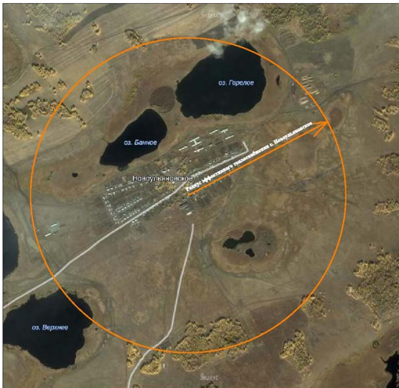
Рисунок 6.1 – Радиус эффективного теплоснабжения с. Новоульяновское.

На основании полученных данных можно сделать вывод, что существующая жилая и социально-административная застройка с. Новоульяновское полностью находится в пределах радиуса эффективного теплоснабжения, и подключение новых потребителей в границах сложившейся застройки экономически оправдано.